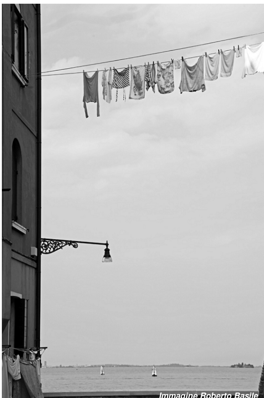
Immagine Roberto Basile

Riflessioni sul pensiero di Thomas Ogden