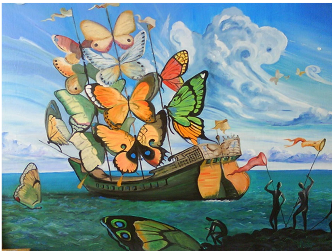
V. KUSH - Senza titolo.